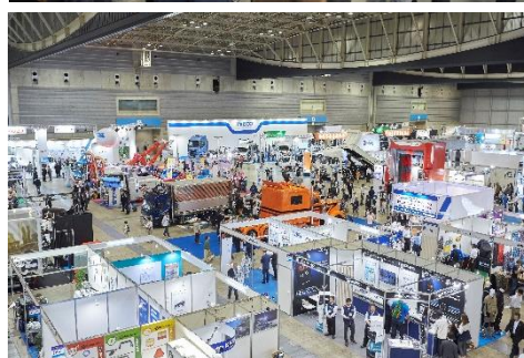
※前回ジャパントラックショー2018の様子