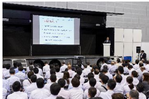
※盛況だった前回の講演の様子

自動運転、隊列走行、ダブル連結トラック、コネクティッド、IoTなどをキーワードに、ハード面の技術革新が著しい物流業界における最新情報の講演、また昨今の業界課題であるドライバー不足に対応し成功を収めた物流企業によるパネルディスカッションや、トラック輸送の生産性向上・効率化を目指すホワイト物流に関する講演など、物流企業にとって関心の高い話題をテーマにプログラムを構成し、来場者誘致に努めます。