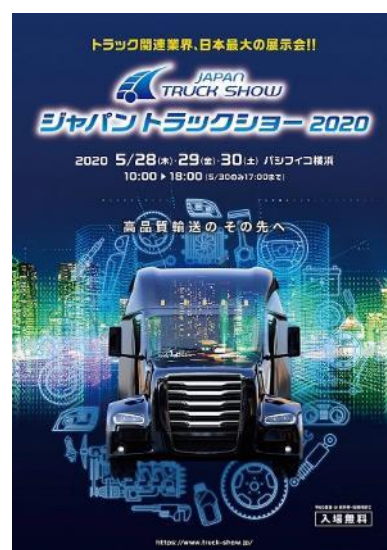
※ジャパントラックショー2020 ポスターイメージ

ジャパントラックショー2020のキービジュアルは、今回のテーマである「高品質輸送のその先へ」を、トラック輸送を支える多彩なパーツをまとめて未来へ発信するトラックをイメージしてデザインしました。